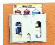
802 000 001 Porte document plastique autocollant