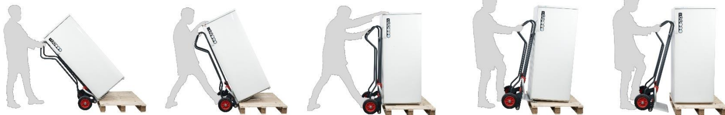
Pose et dépose d'un réfrigérateur sur une palette