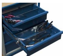
882 006 036 – Cloisonnements pour tiroirs hauteur 100 mm, soit les deux premiers tiroirs. 6 cloisons incluses.