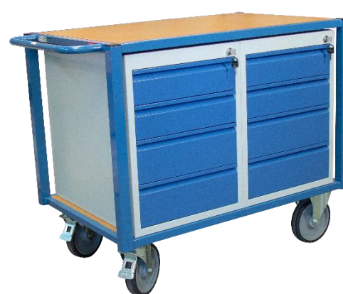
880 002 990 – 2 blocs tiroirs