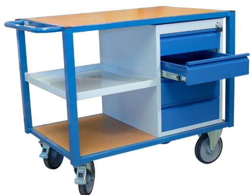
880 002 989 – ½ plateau tôle + 1 bloc 4 tiroirs