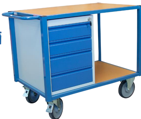
880 002 988 – 1 bloc tiroirs