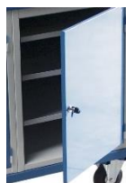
882 006 037 – Etagère supplémentaire pour bloc porte. 4 étagères maxi avec 9 emplacements possibles réglables au pas de 55 mm.