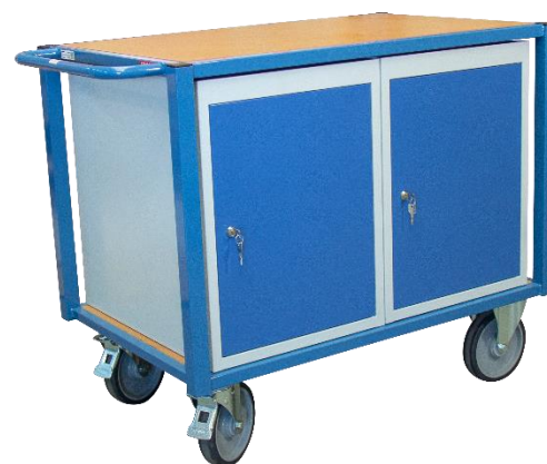
880 002 994 – 2 blocs porte