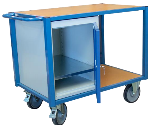
880 002 992 – 1 bloc porte