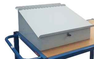
882 006 039 – Pupitre à poser avec écritoire verrouillable 440 x 520 mm.