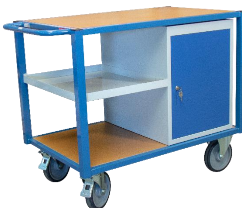
880 002 988 – ½ plateau tôle + 1 bloc porte