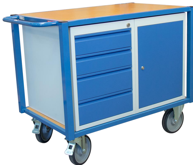
880 002 991 – 1 bloc porte et 1 bloc tiroirs