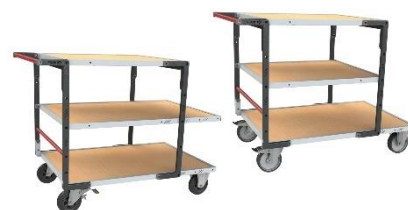
Différentes combinaisons de plateaux