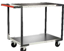
Plateau tôle galva